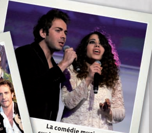
La comédie musicale «1789» sur la scène des Trophées 2012