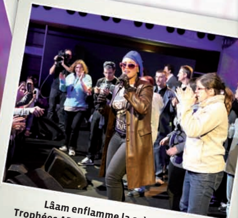
Lâam enflamme la scène des Trophées APAJH 2012