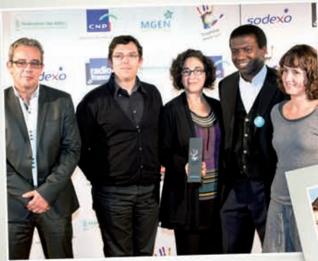
Trophée «Ville Citoyenne» à La Rochelle - Lauréats 2012 (Sirus - FC2)