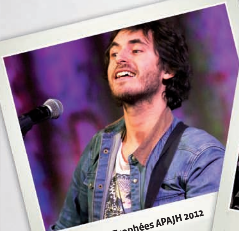
Mickael Miro - Trophées APAJH 2012