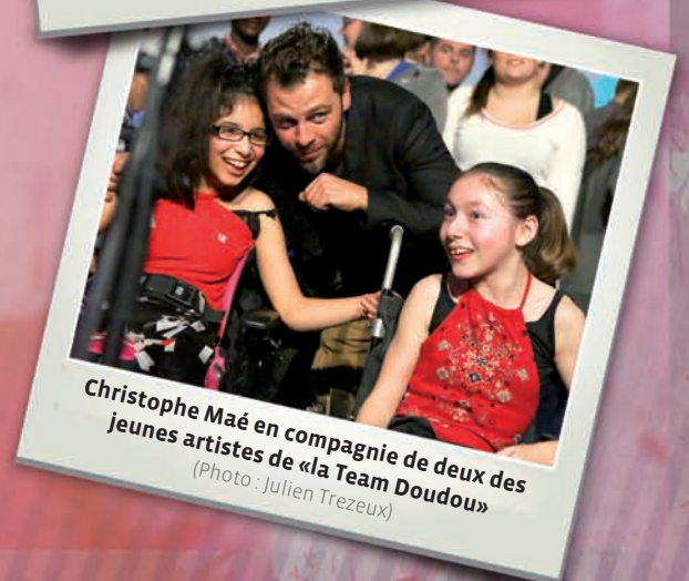
Christophe Maé en compagnie de deux des jeunes artistes de «la Team Doudou»