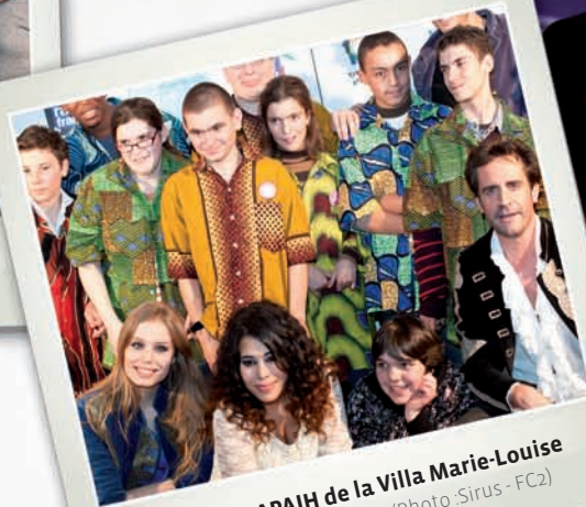
Artistes APAJH de la Villa Marie-Louise et la troupe «1789»